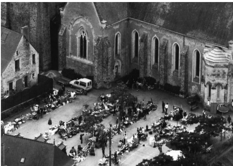
Le vide grenier vu du ciel, 14 septembre 2008

Ces trois publications et cette rencontre seront, nous le souhaitons, vectrices d'échanges, de rencontres et d'enrichissement mutuel !