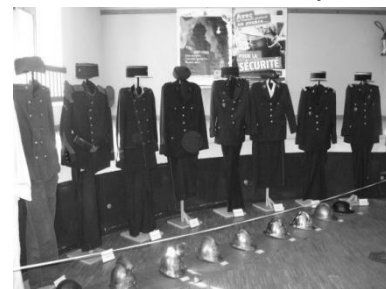
Uniformes de pompiers, le 21 septembre 2008, à CHEVIRE !